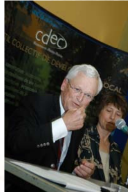
M. Claude Béland et Mme Françoise David ont su captiver l'auditoire lors de la conférence échange qui avait lieu après l'assemblée générale du 22 juin.